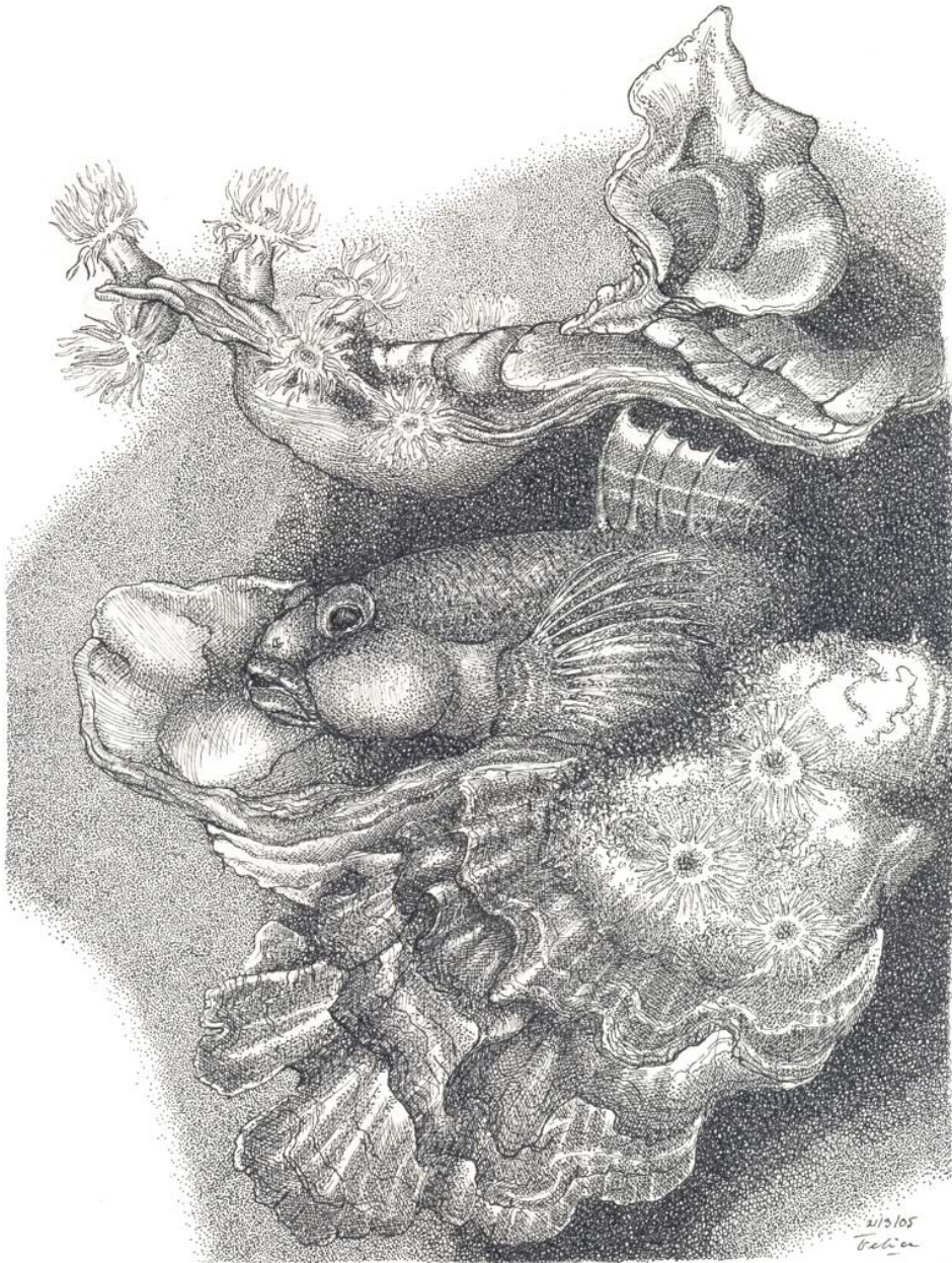
Figuur 1. Impressie van de vondst van Gobius paganellus (tekening Felicia de Zwart).