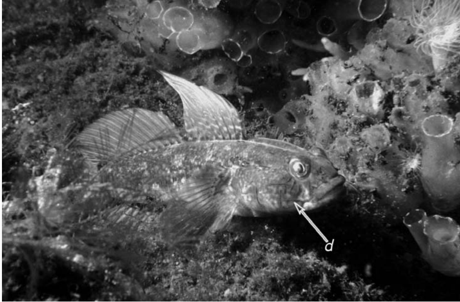
Figuur 4. Gobius niger . Exemplaar uit het Grevelingenmeer met een aantal typische kenmerken: verlengde stralen van de eerste rugvin en in de lengte relatief weinig maar grote schubben. De suborbitale rij sensorische papillen d (zie pijl) vormt een doorlopende rij. Scharendijke, 12 september 1982.

Het verspreidingsgebied van de Paganelgrondel is zuidelijk: van west Schotland tot aan Mauretanië. Ook wordt de soort gevonden in de Middellandse Zee en Zwarte Zee; via het Suezkanaal heeft de Paganelgrondel inmiddels ook de Rode Zee weten te bereiken. In de Noordzee was de soort nog niet bekend (Nijssen & De Groot, 1974; Rappé & Eneman, 1986; Daan, 2000), ook niet langs de oostkust van Groot Brittannië. De soort zit wel in het Kanaal; zo vermeldt Otten (1989) de soort van Siouville-Hague in Normandië.